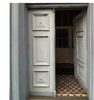
(Eingang der Beratungsstelle Neustadt)

Wir sind ein Team von sieben Berater*innen, deren Stundenkontingente zusammen 2,5 Vollzeitstellen umfassen. Alle sind psychologisch ausgebildete Beratungsfachkräfte mit unterschiedlichen Ergänzungsqualifikationen.